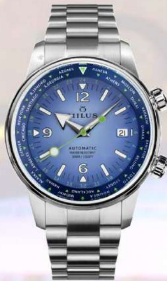
ワールドタイマー ブルーオデッセイ