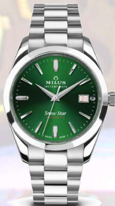
ボレアルグリーン