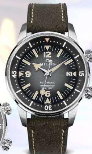
グラベルブラック