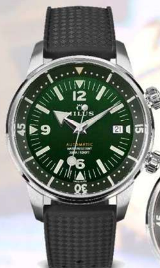
ワイルドグリーン