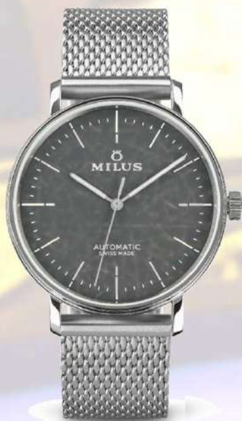
ストリートブラック