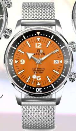
オレンジコーラル