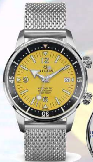
イエローストーン