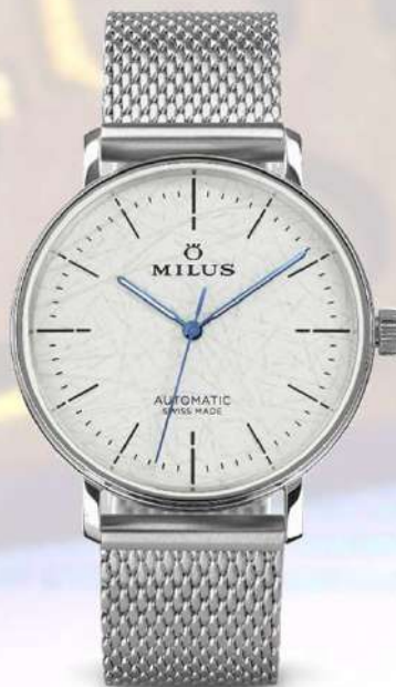
コンクリートグレー