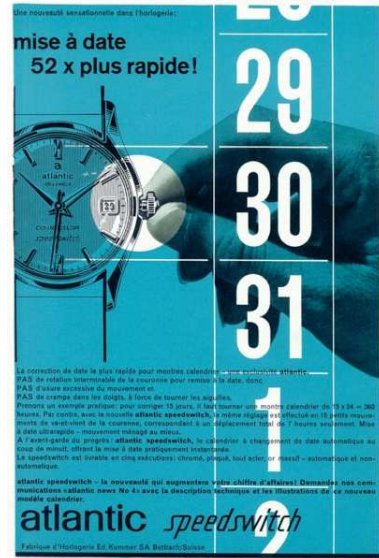
スピード・スイッチの広告

会社は当初はEKB（Eduard Kummer Bettlachの略）と呼ばれていました。1932年、六分儀をロゴにあしらった「アトランティック」名義の最初の時計が発表され、その中には最初の防水クロノグラフも含まれていました。1960年の「スピード・スイッチ」の発明は、時計製造の歴史に金字塔を打ち立てました。この技術革新により、日付の切り替えがそれまでの52倍の速さで行えるようになりました。この技術革新を他の時計メーカーに売り込むことで、アトランティックは時計製造の技術を明確に示しました。